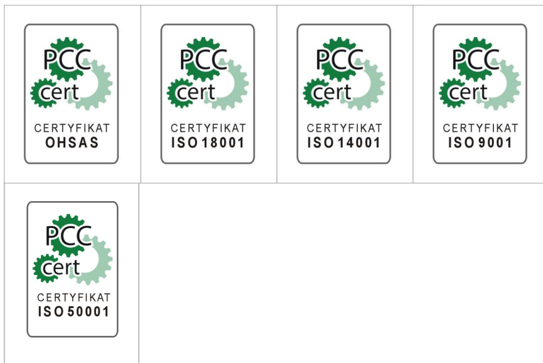
Rysunek 1 Wzór znaku certyfikacji PCC (w zależności od rodzaju systemu zarządzania).

Organizacja uprawniona jest do przedstawiania znaku certyfikacji (odpowiedniego dla systemu zarządzania) przy uwzględnieniu poniższych zasad.