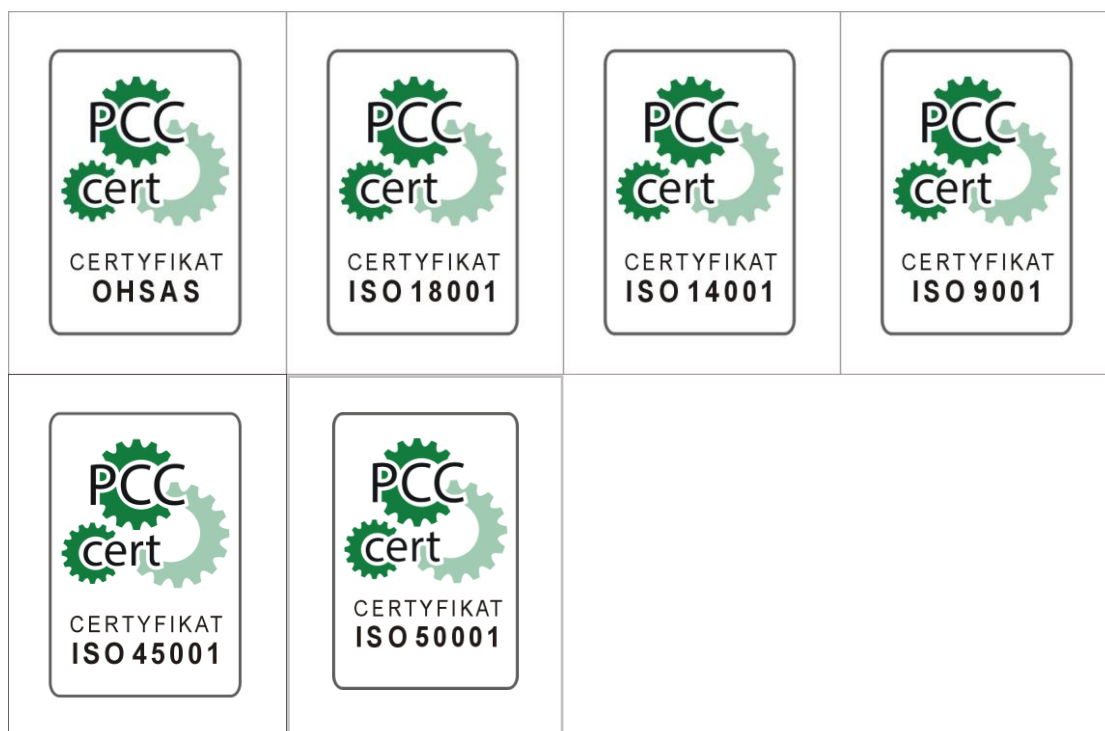
Rysunek 1 Wzór znaku certyfikacji PCC (w zależności od rodzaju systemu zarządzania).

Organizacja uprawniona jest do przedstawiania znaku certyfikacji (odpowiedniego dla systemu zarządzania) przy uwzględnieniu poniższych zasad.