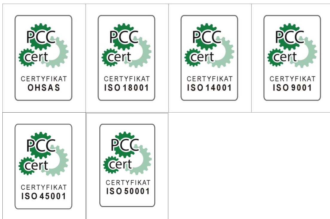
Rysunek 1 Wzór znaku certyfikacji PCC (w zależności od rodzaju systemu zarządzania).

Organizacja uprawniona jest do przedstawiania znaku certyfikacji (odpowiedniego dla systemu zarządzania) przy uwzględnieniu poniższych zasad.